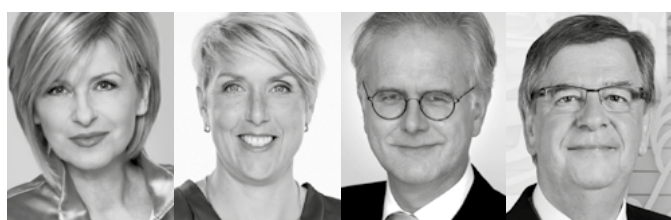
Carmen Nebel Christina Obergföll Harald Schmidt Willi Stächele